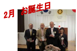
長江・松原・山崎