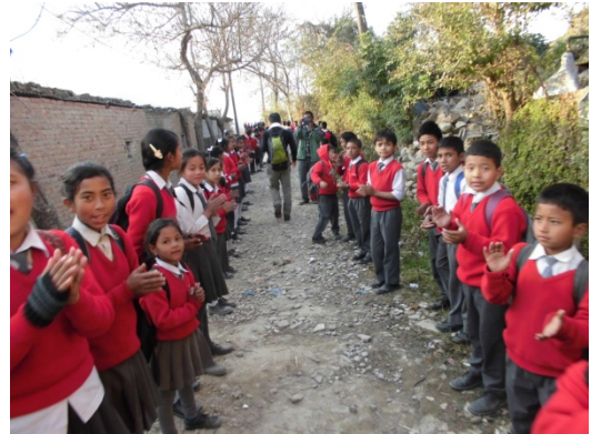
ジュニアハイスクールの生徒さんから歓迎を受けました。