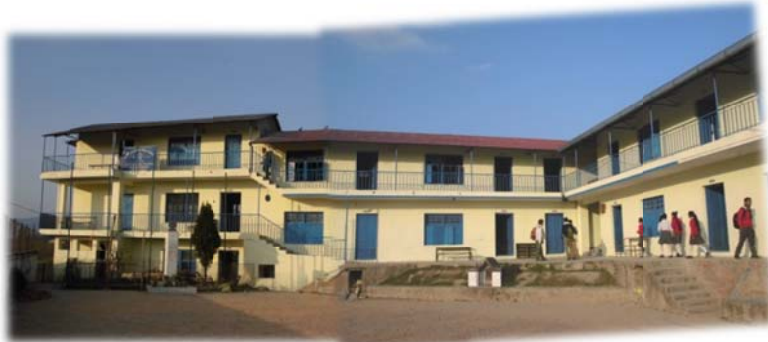
Yuwagratiya Secondaryschool (NEPAL)