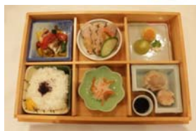
(スカイホテル苅田)