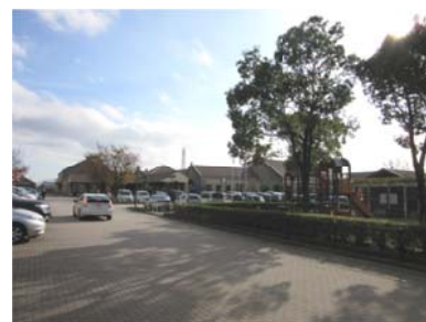
～ パンジープラザ ～

健康診断があって車を止められない時（1月14/28・2月18/25・3月10/24）は、 上記B、の車は、近隣の駐車場に止める。 週報と次週の例会の時に会員に連絡する。ということになりました。