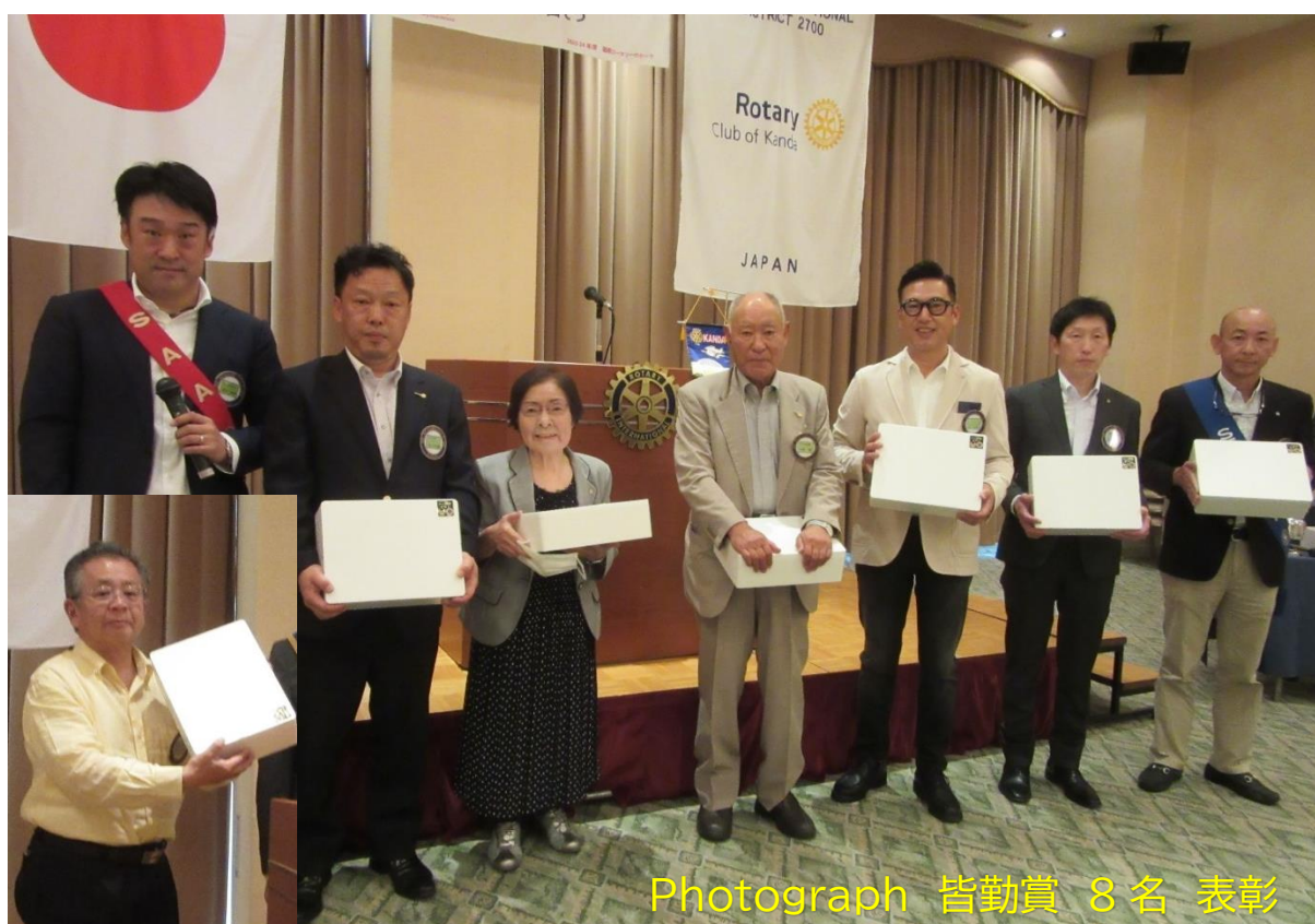
Photograph 皆勤賞 8名 表彰