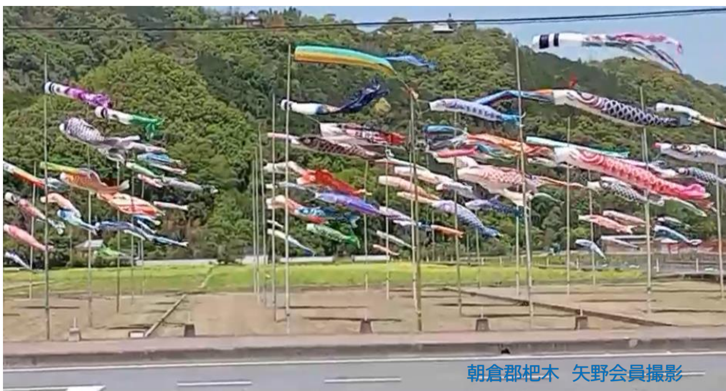
朝倉郡杷木