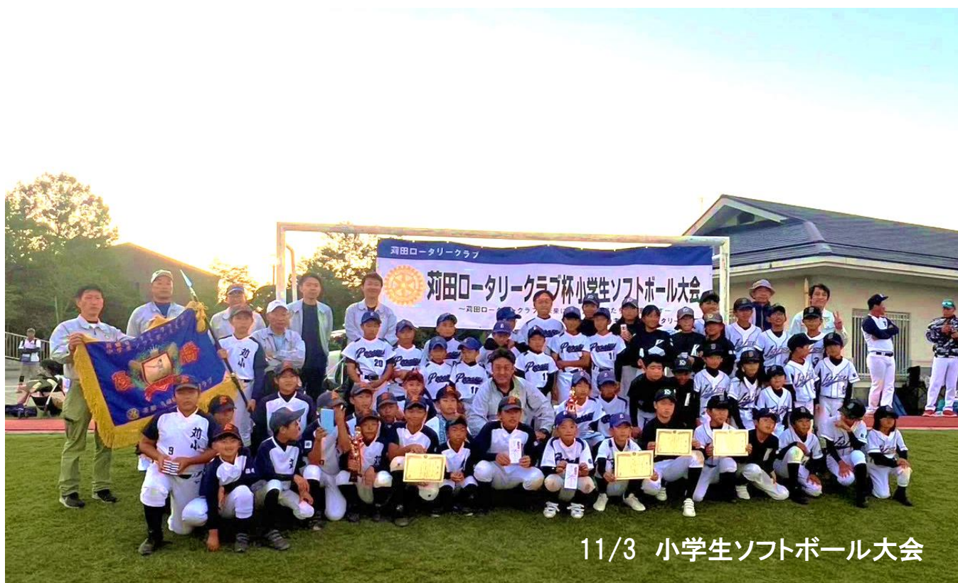
11/3 小学生ソフトボール大会